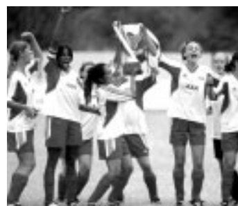
Bend it like Beckham (2002)

Although the subject matter of Das Wunder von Bern is specifically German, like many other sporting films it is actually about much more than sport itself. It has some characteristics of a so called Heimatfilm , in its yearning for the past. But it also features central characters who overcome great odds in order to succeed. In the boxing films Rocky or Million Dollar Baby for example, the characters fight off all kinds of challenges and become heroic through their sport. The documentary Hoop Dreams follows the lives of two African American boys who struggle to become college basketball players in inner city New York. A new Irish film, Studs , features a down-at-heel team coached to victory by a stranger who becomes their manager. In Das Wunder von Bern , Matthias' hero, Helmut Rahn, contrasts with the anti-hero figure of his father. Yet Rahn too is flawed and it is through Matthias' affection and the game itself that both men become heroic figures. Despite the massive popularity of soccer, there are actually few films solely about the game. Since it is impossible to explain the development of a match through filmic narrative, films about football usually contain other stories too.