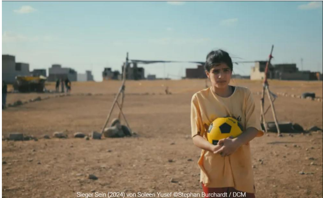
Sieger Sein (2024) von Soleen Yusef

Wie wird im Film gezeigt, dass sich Mona erinnert, wie wird die Realität dargestellt?