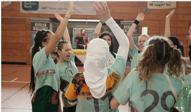
2. Quelle: DCM Film Distribution, DFF , © Stephan Burchardt, DCM "Sieger sein" (2024)