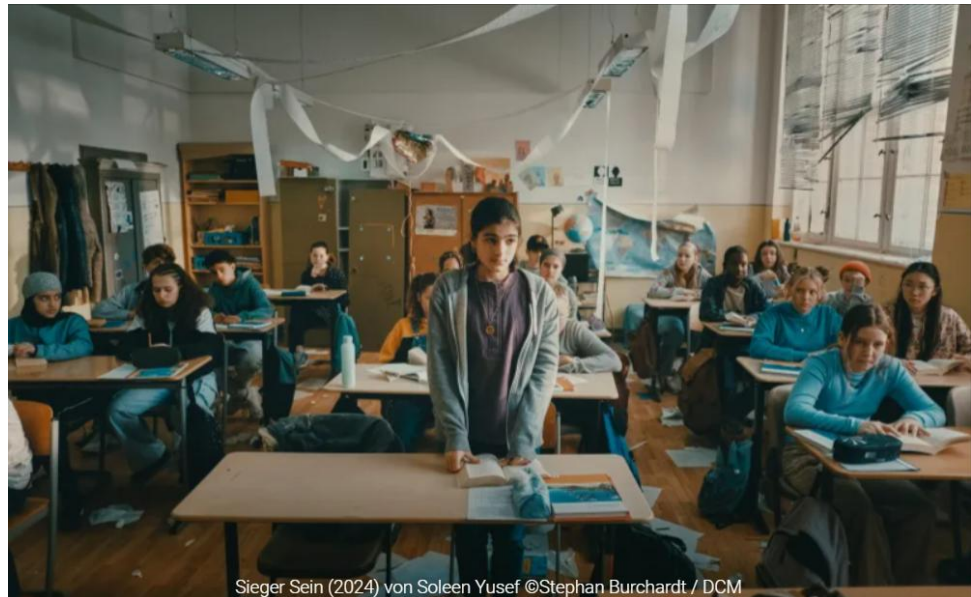
Sieger Sein (2024) von Soleen Yusef

Materialien (A2) des Goethe-Institut Irland, September 2025 „Für Frieden muss man arbeiten“ Mona, Sieger sein